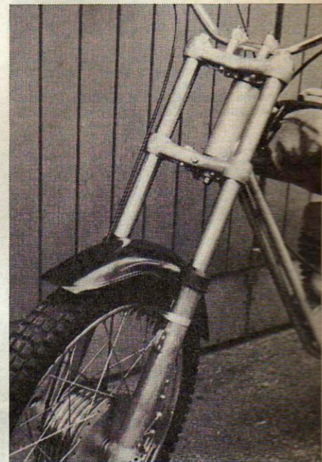
Sprite-tehtaan uudet etuteleskoopit ovat jo iloinen luku sinänsä. Ne ovat kopioitua Cerianin ja Bultacón vastaavista, ja on syytä olettaa, etteivät ominaisuudet ole ainakaan huonommat. Joustoliikkeen pituus on peräti seitsemän tuumaa. Myönteinen piirre on myös se, että etupää on laakeroitu emäputkeen kookkain kartiorullalaakerein.

Virtauskanavat on suunniteltu erityisesti trial-käyttöön. Vaihdelaatikko on erillinen, ja vaihteiden välityssuhteet ovat 8,3:1, 11,4:1, 17,3:1 ja 29,1:1.