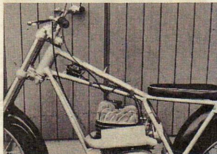
Rungon tukevuudesta saa käsityksen jo tutkimalla polttoainesäiliön alla olevaa rakennealaa.

Virtauskanavat on suunniteltu erityisesti trial-käyttöön. Vaihdelaatikko on erillinen, ja vaihteiden välityssuhteet ovat 8,3:1, 11,4:1, 17,3:1 ja 29,1:1.